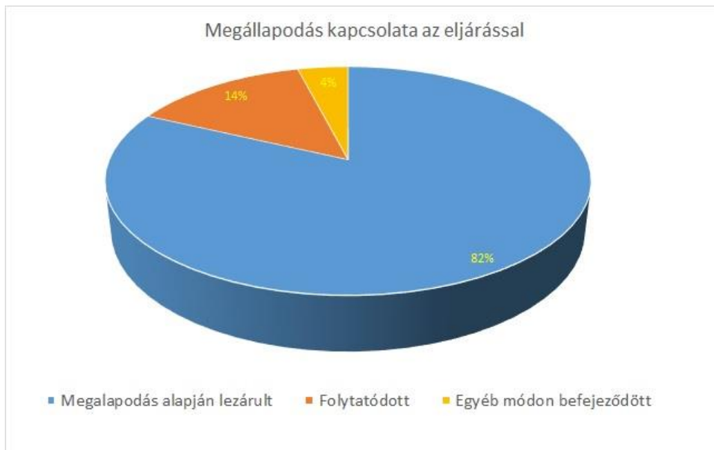
3. ábra 9

Az utánkövetés során tapasztaltakból továbbá az is megállapítható volt, hogy a felek részéről kifejezett igény mutatkozik a közvetítői eljárásban kötött megállapodásaik perbeli legitimációjára, annak bíró általi jóváhagyására, mely ugyancsak a két eljárás erőteljes összekapcsolódását mutatja.