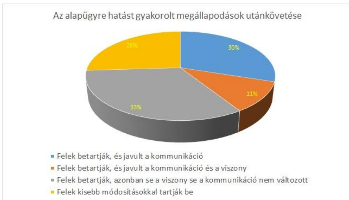
8. ábra 10

A felek nyilatkozatai alapján egyértelműen megállapítható volt az a törvényszerűség, hogy azokat a megállapodásokat, melyek a peres eljárásban is legitimizálásra kerülnek, illetőleg amely megállapodások a per megszüntetésére irányulnak, azokat a felek a jövőben is tartják. A felek viszonyának és kommunikációjának pozitív irányú változása nagyban függ attól, hogy konfliktusuk mely szakaszában érkeztek a közvetítőhöz. A felek sok esetben hivatkoztak arra, hogy semmi nem változott közöttük, azonban az a tudat, hogy a megállapodást közösen alkották meg, ez irányt mutat számukra, melyhez egyértelműen kötik magukat.